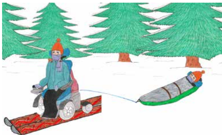
ILLUSTRATION: PETRA GUNNARSSON