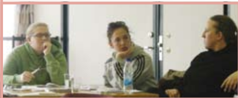
Diskussioner, rollspel och föreläsningar inspirerade arbetsledarna.

– Jag tycker det här har varit väldigt spännande och nyttigt. Nu ska jag hem och pröva allt jag lärt mig här. Det är också roligt att se hur andra arbetar och har det.