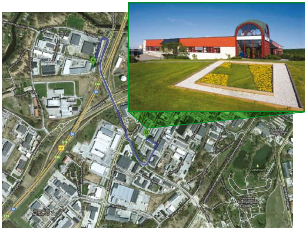
Kartan visar vägen från det gamla kontoret till det nya kontoret i Örebro. Det gamla kontoret ligger vid punkt A och det nya kontoret ligger vid punkt B.

Inflyttningsfest kommer att arrangeras i maj. Mer info om det i nästa nummer av Vivida Nytt.