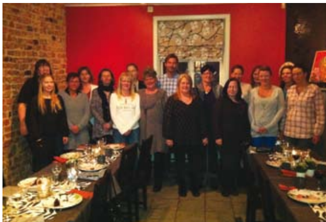
Assistensgänget i trevlig miljö.

Onsdagen den 1 februari arrangerades på Antons krog i Trosa en assistentträff. Ett drygt tjugotal personer hade hittat dit. Det blev en mycket trevlig afton med god mat i den trevliga miljön och en spännande tävling där kunskaper i musik och geografi sattes på hårt prov hos deltagarna. Efteråt var alla mycket nöjda och glada med aftonen.